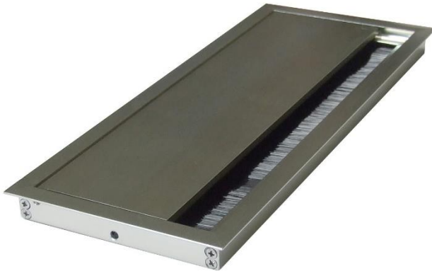
Artikel: 9-00-100563 Titanium