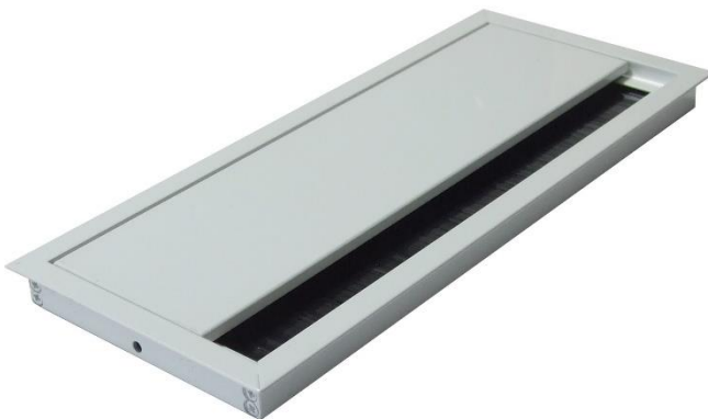
Artikel: 9-00-100562 Weiß matt

Kabeldurchführung aus Aluminium, mit geradem Klappdeckel, schwarzer Bürstendichtung und sanfter Schließfunktion