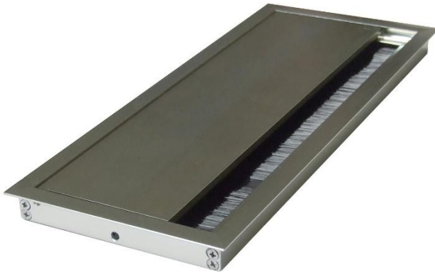
Artikel: 9-00-100565 Titanium