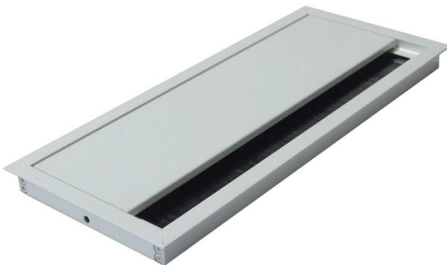
Artikel: 9-00-100564 Weiß matt

Kabeldurchführung aus Aluminium, mit geradem Klappdeckel, schwarzer Bürstendichtung und sanfter Schließfunktion